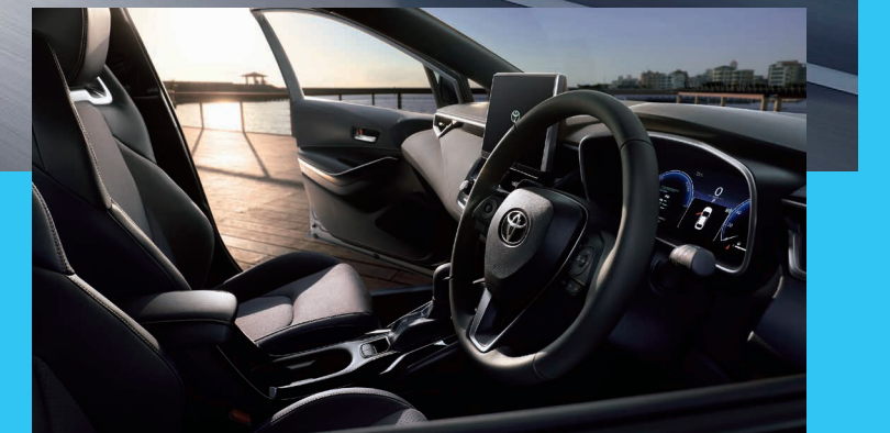
Photo:コローラ 特別仕様車 ACTIVE SPORT。ボディカラーは特別設定色セメントグレーメタリック(1H5)。内装色はブラック。