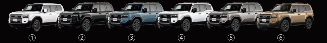
①スーパーホワイトII(040) ②ブラック(202) ③スモークブルー(8X0) ④ブラチナホワイトパールマイカ(089) メーカーオプション(33,000円) ⑤アバンギャルドブロンズメタリック(4V8) ⑥サンド(5C8)