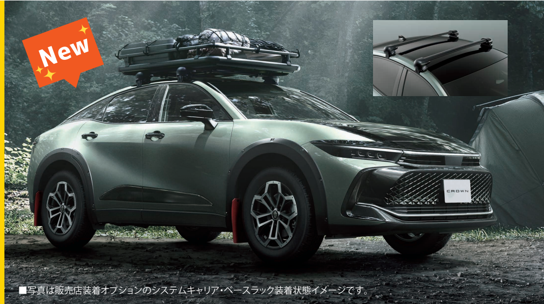
Photo:特別仕様車 CROSSOVER RS "LANDSCAPE" (ベース車両はCROSSOVER RS)。ボディカラーは特別設定色ブラック(227)×アーバンカーキ(6X3) [M36]。