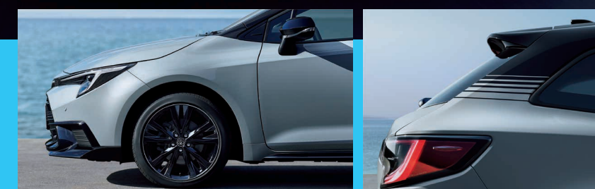
Photo:コローラ ツーリング 特別仕様車 ACTIVE SPORT。ボディカラーの特別設定色アディチュードブラックマイカ(218)×セメントグレーメタリック(1H5) [1YY]はメーカーオプション(55,000円)。内装色はブラック。

コローラ ツーリング 特別仕様車 ACTIVE SPORT (ハイブリッド車・2WD)