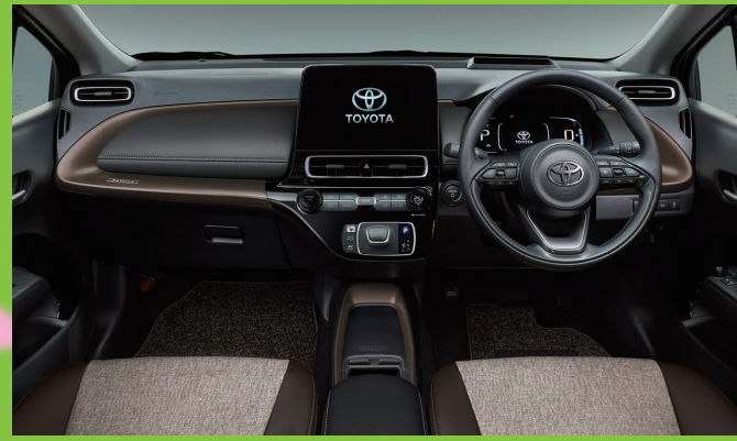
Photo:特別仕様車 Z "Raffine" (2WD) [ベース車両はZ (2WD)]。トヨタチームメイト[アドバンストパーク]+パーキングサポートブレーキ(周囲静止物)とカラーヘッドアップディスプレイはセットでメーカーオプション(86,900円)。合成皮革+コンフォートパッケージ(シート表皮は合成皮革+ストライプ柄ファブリックとなり、フロントコンソール、アッパーボックス、ドアトリムについての内装色は、ブラックとなります)はメーカーパッケージオプション(66,000円)。